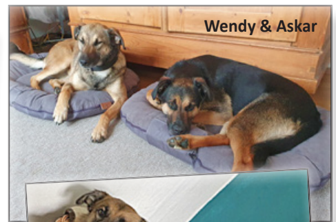
Wendy & Askar

Wir wollten auf keinen Fall die zwei Hundepaare trennen, die sich so sehr lieben. Was hätten wir den Tieren angetan, wenn wir sie auseinandergerissen hätten. Wir haben für Wendy und Askar ein tolles Zuhause gefunden und für Ben und Nero ebenfalls. Den Besitzern der Hunde danken wir für ihr großes Herz!