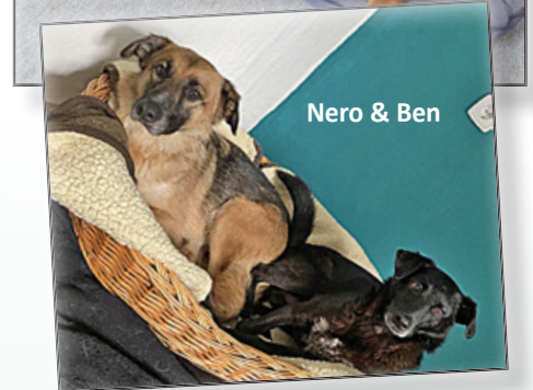
Nero & Ben