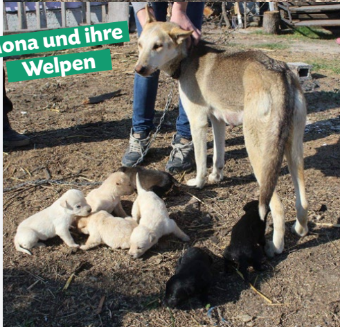
Mona und ihre Welpen