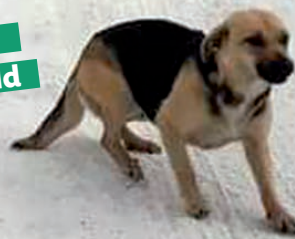
Dana im Wald

Eines Tages humpelte sie, eine Operation an der linken Schulter musste erfolgen, doch eine zufriedenstellende Besserung hat ihr die OP noch nicht gebracht. Dabei war sie so fit, wie sie nach Deutschland kam.