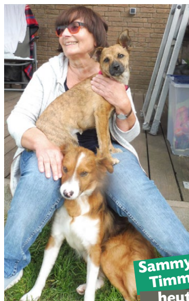
Sammy & Timmy heute

Eine sehr kleine andere Mutterhündin wurde Dona genannt, nur 35 cm groß, sie hatte schon den zweiten Welpenwurf: Timmy und Sammy. Es sind Hunde aus dem größten Dreck, aber so lieb und dankbar. Timmy konnten wir bereits vermitteln, seine Schwester Sammy ebenfalls.